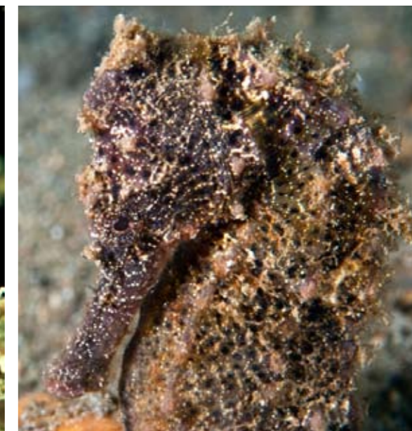
Einde - De laatste minuten van de laatste duik: een zeepaardje!