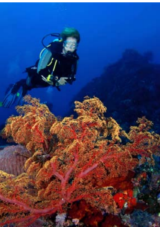
Wiegen in de stroming Prachtig waaierkoraal rondom Gili Lawa Laut.

al rond en we blijven angstvallig tussen onze twee gidsen in lopen. We kiezen voor een kortere hiking trail van anderhalf uur, gezien de toch al stijgende temperatuur in de ochtend. Daarbij hoeven we niet te ver te lopen om de eerste exemplaren van erg dichtbij te kunnen zien. Ze liggen kriskras op het pad lekker in de zon op te warmen. Ze lijken traag, maar hun ogen volgen elke beweging en hun tong flikkert dreigend. We hebben al snel door dat het belangrijk is om het pad aan te houden, want in het hoge gras vallen de varanen nauwelijks op. Maar ja, hoe doe je dat als ze het hele pad blokkeren? Het is parseizoen. Toch zien we er tijdens de trail in totaal zeker twintig en bezoeken we ook wat nesten. Op het hoogste punt van de wandeltocht hebben we prachtig uitzicht over de baai en zien we de S/Y P. Siren liggen. We krijgen zo een goede indruk van de ligging van de eilanden, die in de volksmond gewoon Komodo worden genoemd. In werkelijkheid bestaat het gebied uit een verzameling eilanden, waarvan Komodo het grootste is. Bij terugkomst in het piepkleine dorpje zien we als bonus nog een groep makaken in de bomen, die ons heel dichtbij laten komen. Ondanks de unieke ervaring om deze prehistorische varanen in het echt te zien, zijn we blij dat we weer snel verkoeling kunnen zoeken in het water.