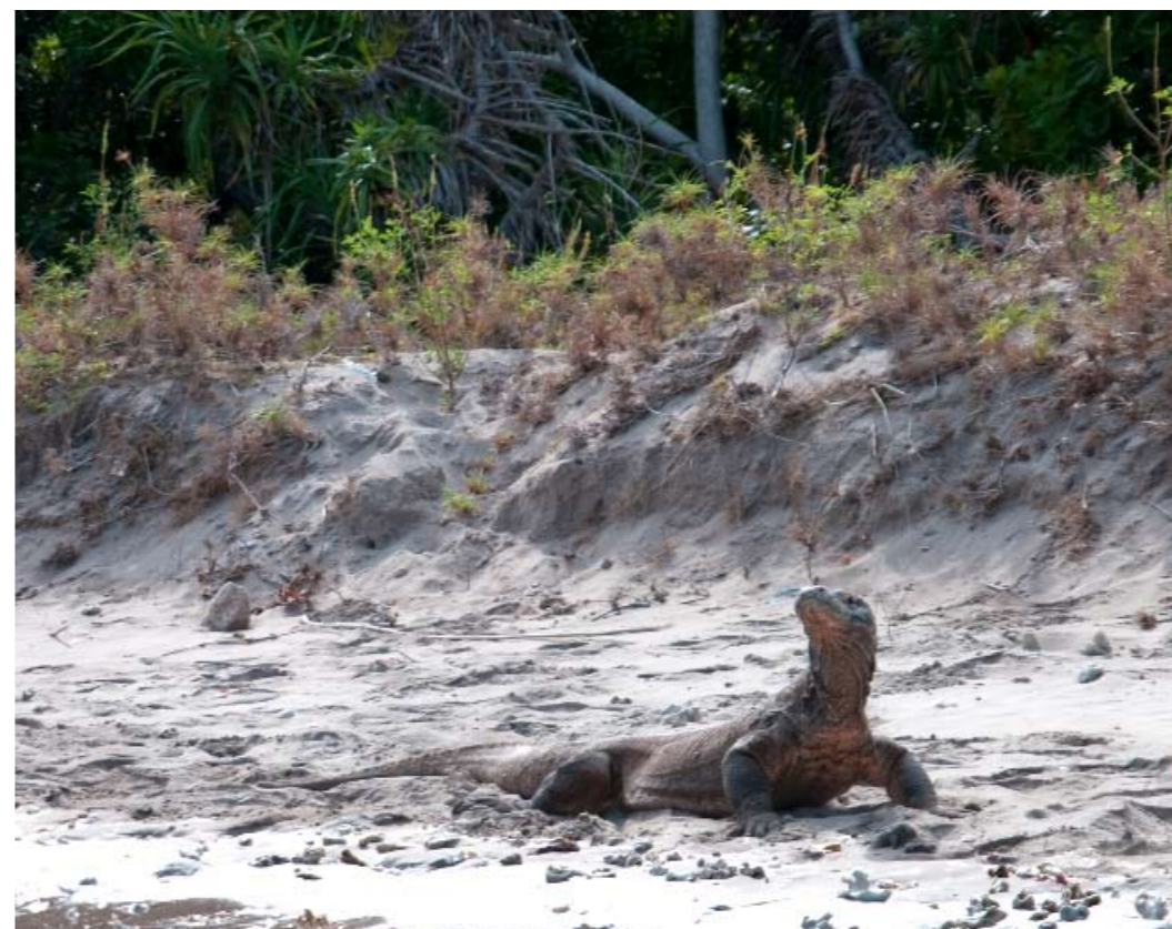
Grootste hagedis - De komodovaraan ruikt een toeristenmenu.