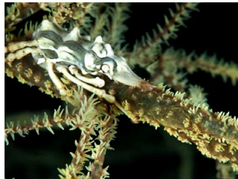
Camouflage - Een koraalkrab verschuilt zich tussen het koraal.

We sluiten deze indrukwekkende reis af met een diashow op het megagrote beeldscherm. Na het diner schuift iedereen, inclusief de bemanning, gezellig aan in de luxe salon en kijken we meer dan twee uur naar de impressie van een fantastische vakantie. Het is Frank en zijn team gelukt een diverse groep gasten zich thuis te laten voelen op hun schip, een gevarieerd duikaanbod met de beste stekken van de regio aan te bieden en een actief programma te combineren met het echte vakantiegevoel. Wat ons betreft was deze maiden voyage op de S/Y P. Siren meer dan geslaagd!